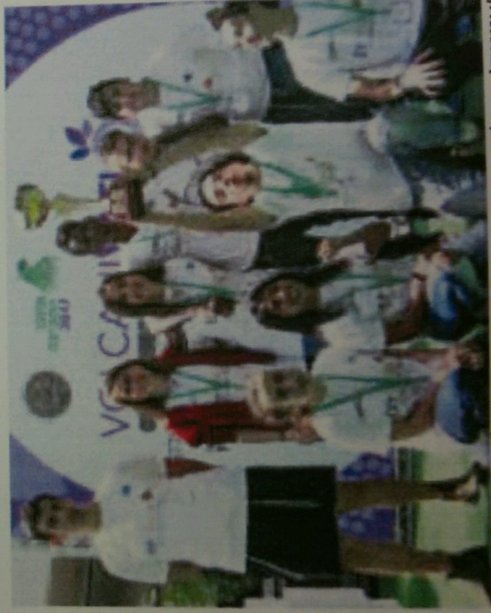
'עיינות' מצילים את הדבורים

התלמידים בלטו עם מיזם שפותח בשיתוף עמותת 'עתיד פלוס' להצללת דבורי הדבש, וזכו בפרס של 15 אלף שקל, מתנת חברת 'אדמה בע"מ'.